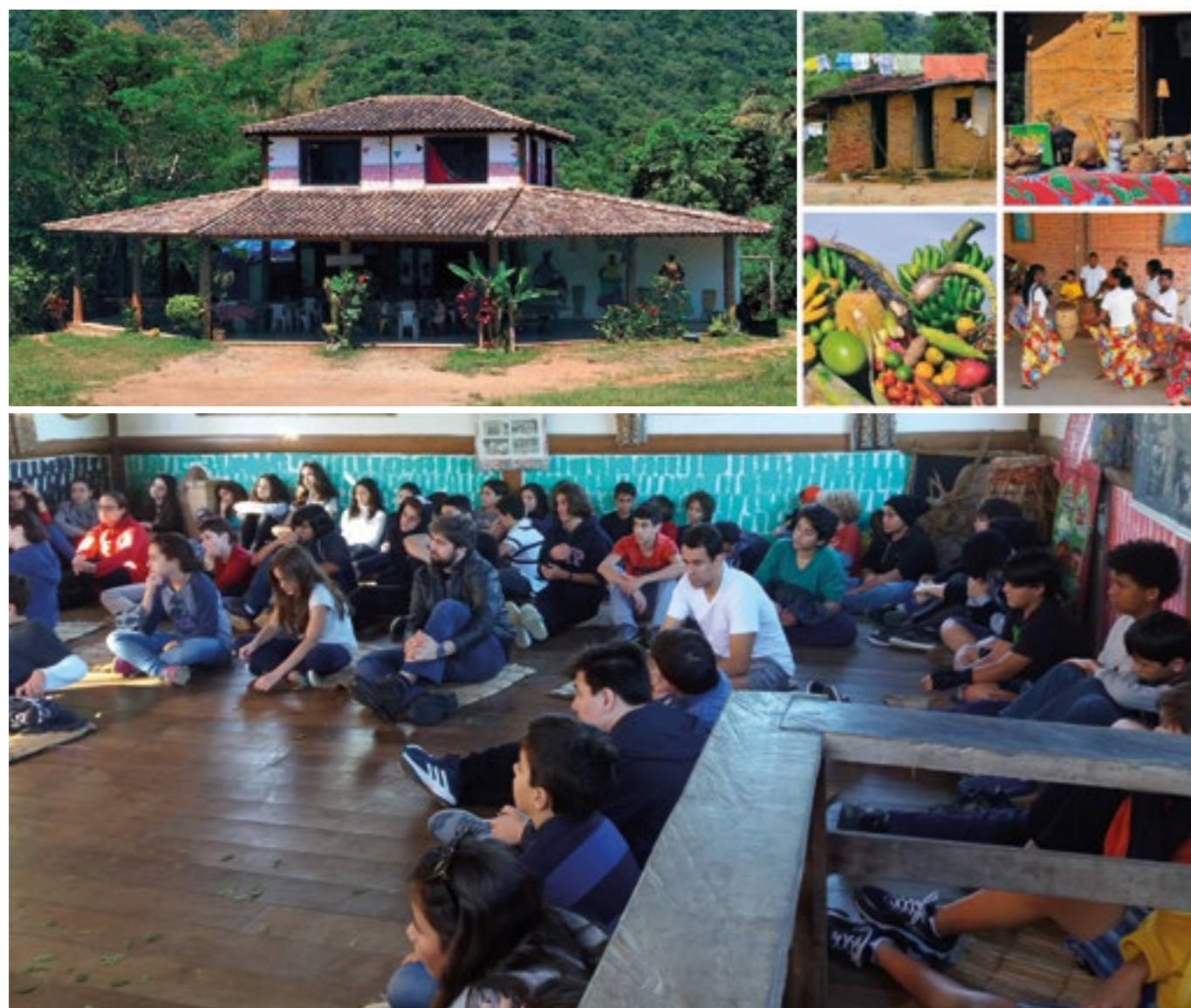
VISITA AO QUILOMBO CAMPINHO DA INDEPENDÊNCIA

Quilombo é o nome dado ao refúgio dos escravos que fugiam de engenhos e fazendas no período colonial e até no período imperial. Nos quilombos, os escravos viviam em liberdade, isso após a vida inteira presos. Eles são uma parte muito importante na história, pois eles eram a "liberdade" dos escravos e, ao mesmo tempo, a resistência deles contra a escravidão.